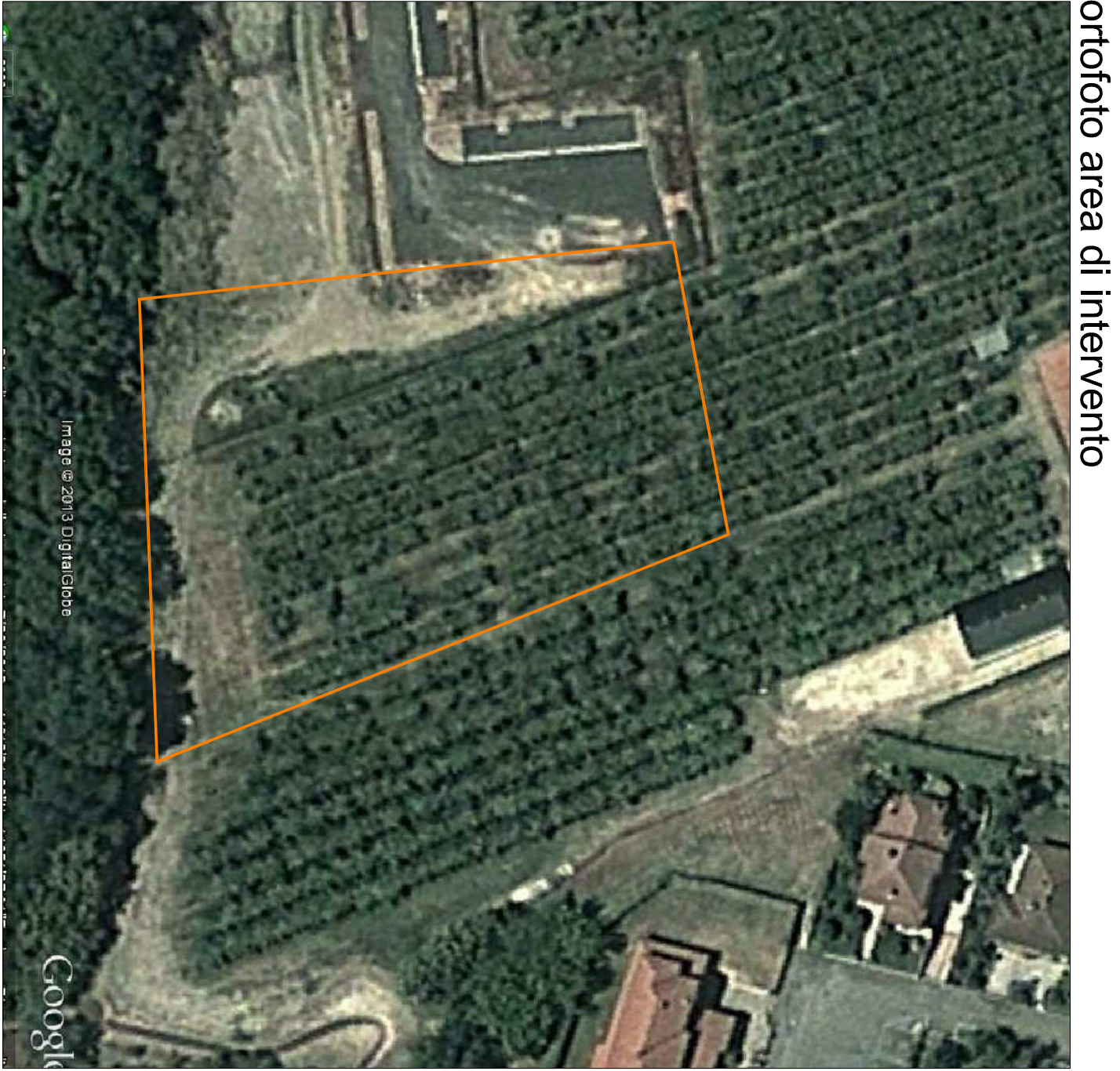
ortofoto area di intervento