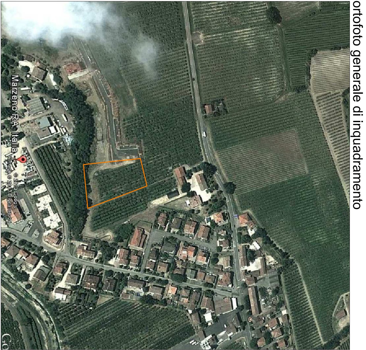
ortofoto generale di inquadramento